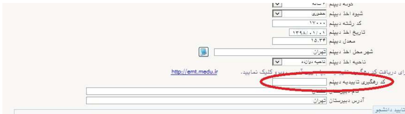
شکل ۱۵- تاییدیه تحصیلی