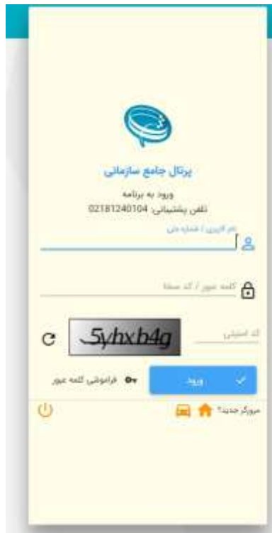
شکل ۳۶- درخواست معافیت تحصیلی