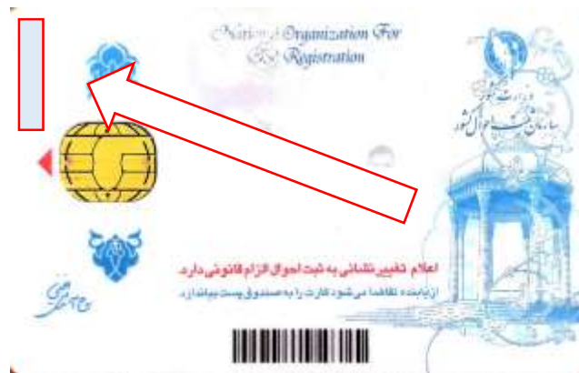
شکل ۹- شماره سریال پشت کارت ملی