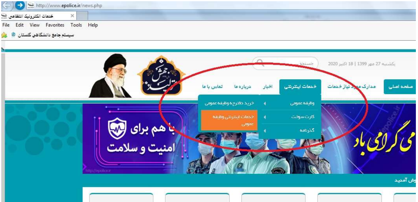
شکل ۳۵- درخواست معافیت تحصیلی