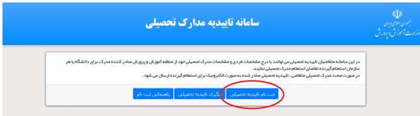
شکل ۱۳- استعلام مدرک تحصیلی از سایت آموزش و پرورش