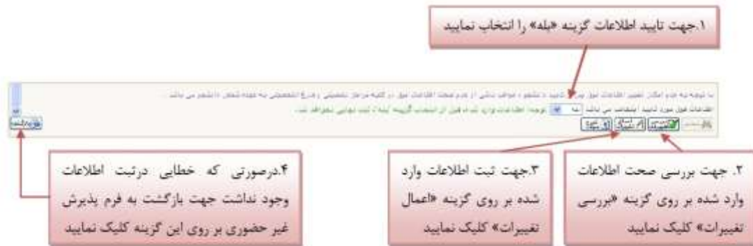
شکل ۱۱- اطلاعات شخصی و محل سکونت دانشجویان