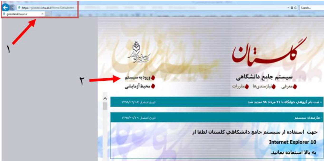
شکل ۱- سیستم آموزشی گلستان دانشگاه خوارزمی