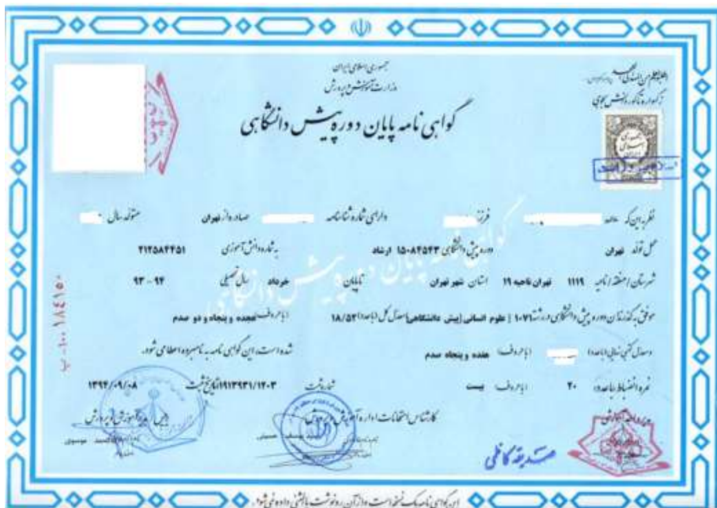
شکل ۲۳- نمونه اصل مدرک پیش دانشگاهی