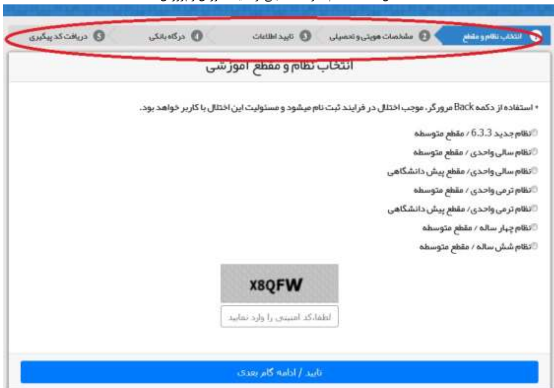
شکل ۱۴- استعلام تاییدیه تحصیلی