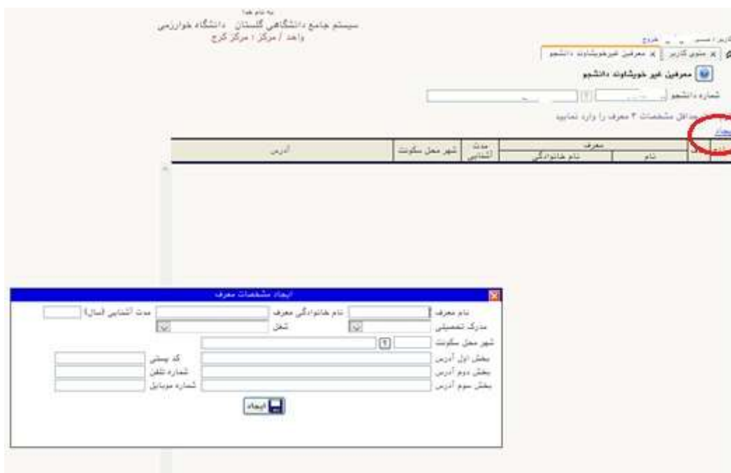
شکل ۲۰- اطلاعات معرفین دانشجو