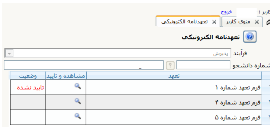
شکل ۲۸- ارسال تعهد نامه الکترونیک

با کلیک بر روی این منو صفحه‌ای مطابق با شکل ۲۸ ظاهر می‌شود. دانشجویان باید مدارک خواسته شده را در این قسمت بارگذاری نمایند.