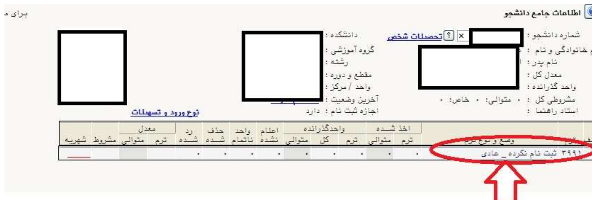
شکل ۳۷- انتخاب واحد دانشجو

آموزش دانشکده مربوطه تماس گرفته و نسبت به حل مشکل مذکور اقدام نمایند ( وضعیت دانشجو بایستی در حال ثبت نام باشد، اگر وضعیت دانشجو در حالت ثبت نام نشده باشد، بمنزله این است که انتخاب واحد انجام نشده است) (شکل ۳۷). دانشجویان محترم می توانند با استفاده از گزارش ۸۸ می توانند پرینت واحد های اخذ شده را بگیرند.