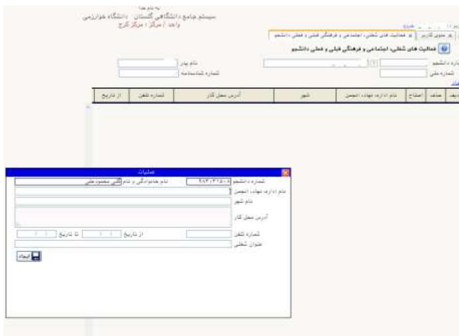
شکل ۲۱- اطلاعات فعالیت های شغلی، اجتماعی و فرهنگی دانشجو

با کلیک بر روی این منو صفحه‌ای مطابق با شکل ۲۱ ظاهر می‌شود. دانشجویان باید اطلاعات مربوط به به فعالیت های شغلی، اجتماعی و فرهنگی خود را بطور دقیق در این قسمت وارد نمایند. لازم است با زدن دکمه ایجاد اطلاعات هر یک از معرفان ثبت شود.