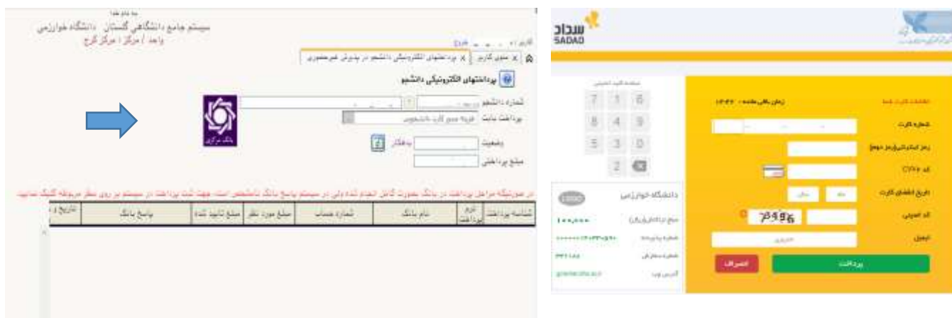
شکل ۳۱- پرداخت الکترونیک هزینه خدمات جانبی آموزشی