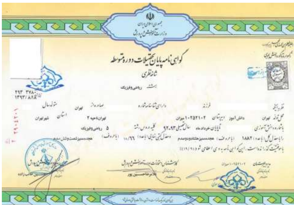
شکل ۲۴- نمونه اصل مدرک دیپلم متوسطه

دانشجویان باید اصل مدرک دیپلم متوسطه یا گواهی آن را را اسکن و در قسمت مربوطه بارگذاری نمایند. نمونه اسکن مربوطه در شکل ۲۴ نشان داده شده است.