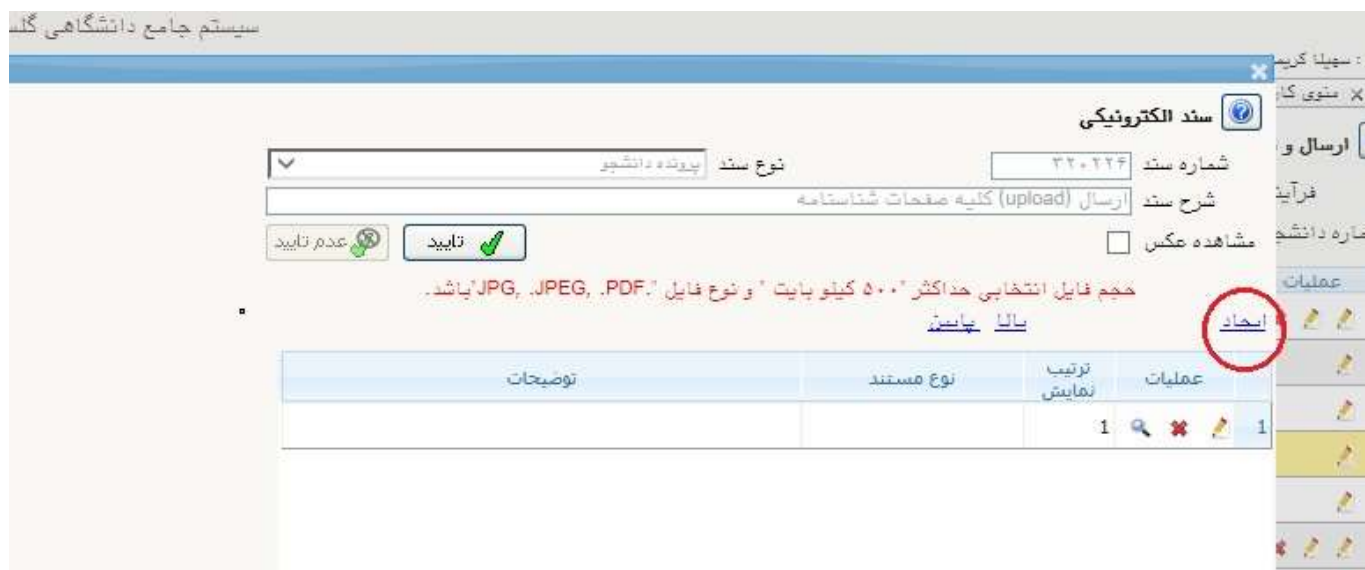
شکل ۲۶- ارسال و تایید مدارک پرونده دانشجو