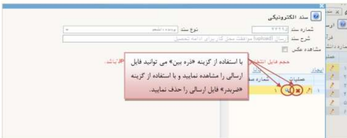
شکل ۲۷- ارسال و تایید مدارک پرونده دانشجوی