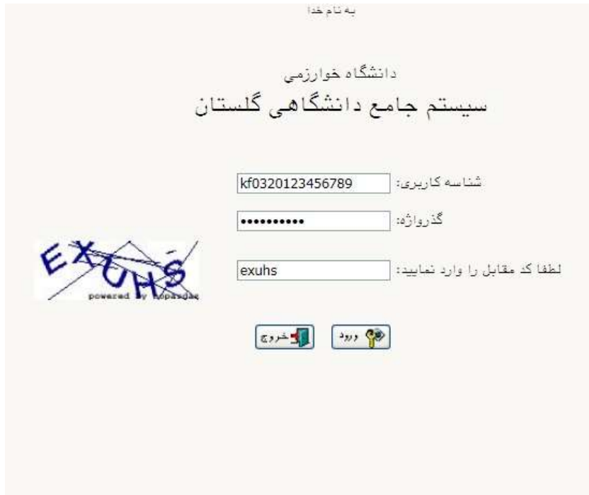
شکل ۲- ورود به سیستم گلستان

گذر واژه برای دانشجویان خارجی شماره گذرنامه می باشد.